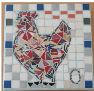
Dalle La Poule en mars 2021

En avril, l'habitante qui porte le projet Ateliers Créatifs a organisé et animé un atelier photophore en mosaïque sur What's App, en raison des restrictions sanitaires.