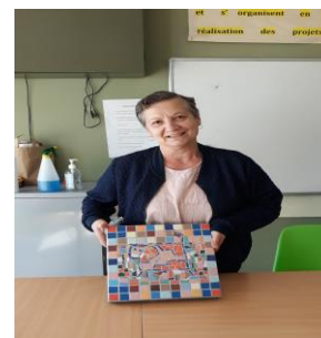
Dalle La Vache en octobre 2021

Le projet Ateliers Créatifs répond aux besoins d'apprendre à faire soi-même quelque chose, de découvrir l'art, de travailler à la créativité des individus et des collectifs