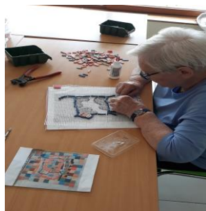
Réalisation de la 4 ème dalle